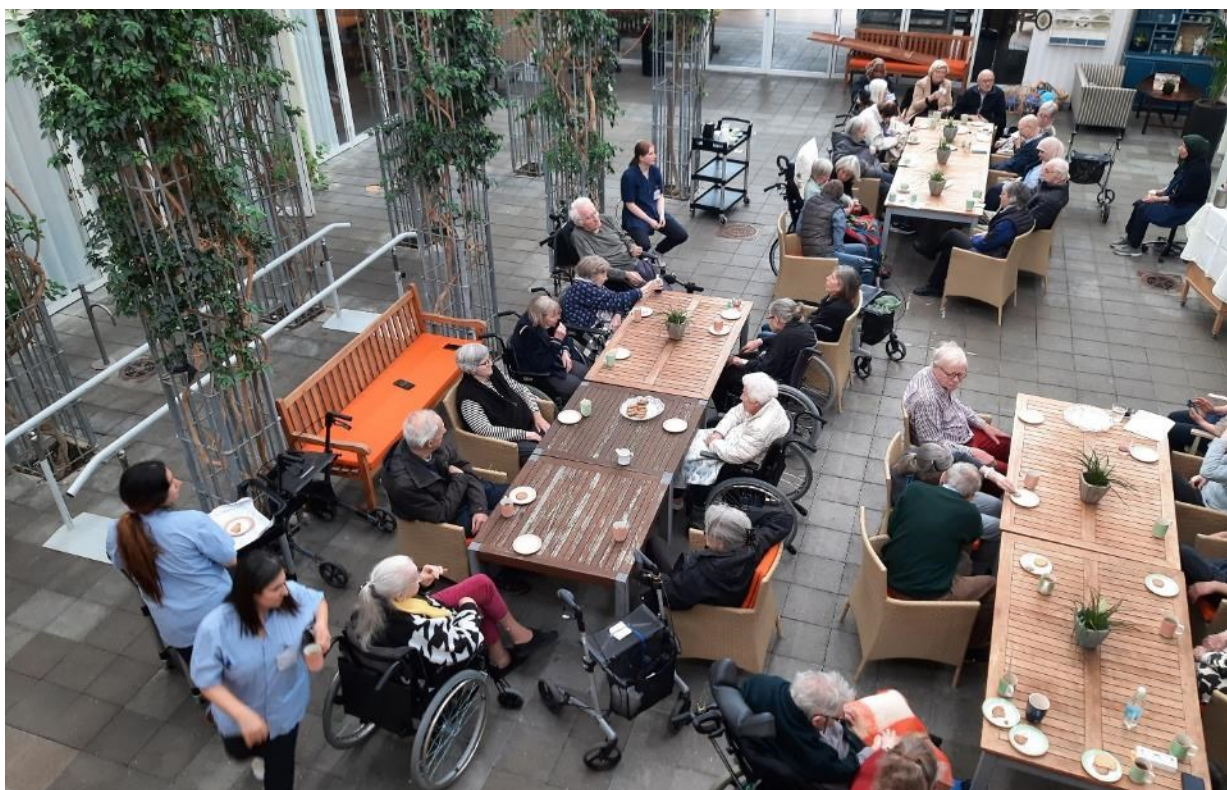
Mange nød Giro413-koncerten med temaet om at rejse og feriedestinationer.