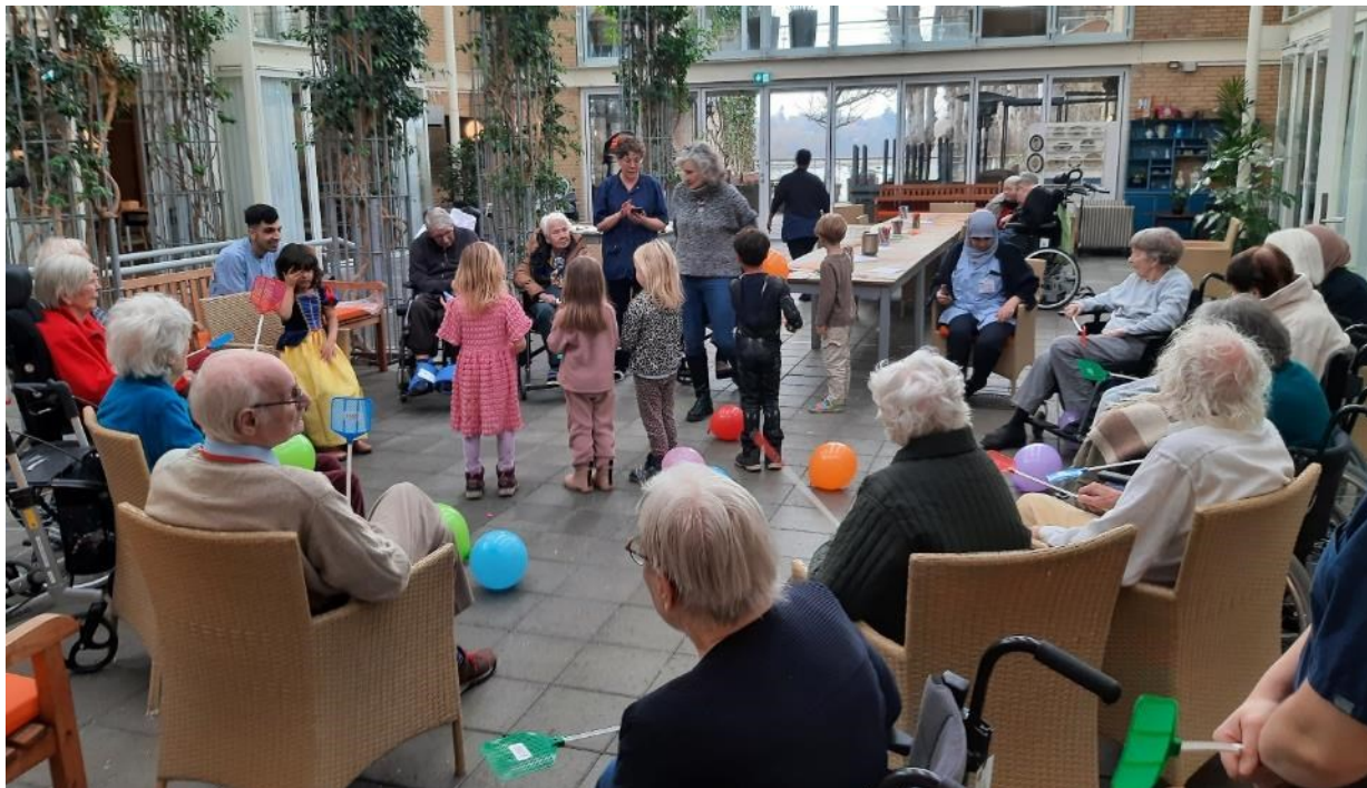
Vi slog til balloner med fluesmækkere og hørte musik, da børnehaven besøgte os i februar.