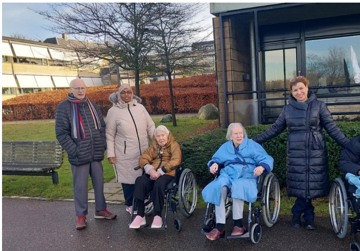
Gåtur i flot vintervejr