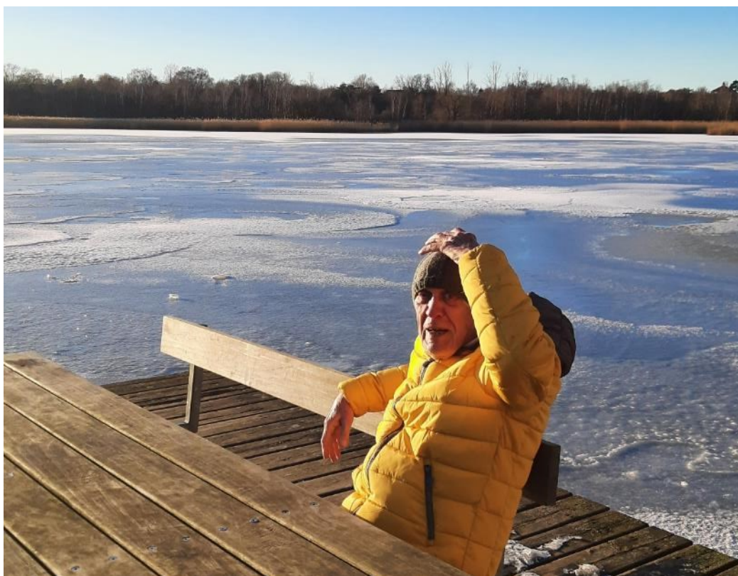
Flot vintervejr ved Gentofte Sø