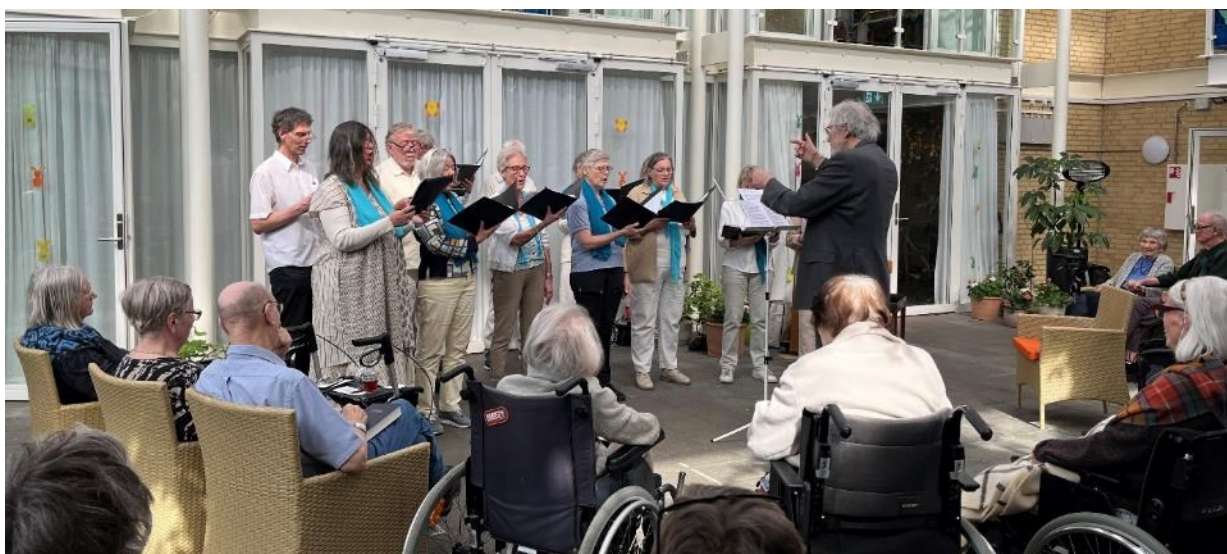
Cantabo-koret sang for beboere og pårørende på palmesøndag.