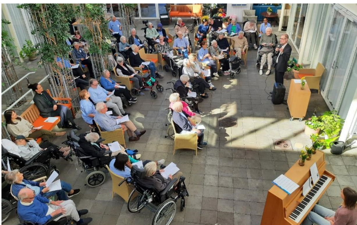
Påskemærkeringen, hvor bl.a. forstander og direktion fra Diakonissestiftelsen deltog, var en fin stund med sang og fællesskab.