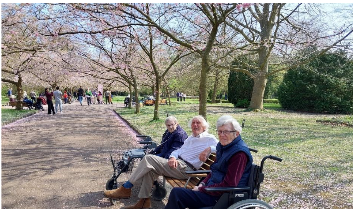
Kirsebær-alléen på Bispebjerg Kirkegård var målet for udflugten for nogle beboere på 1. sal.