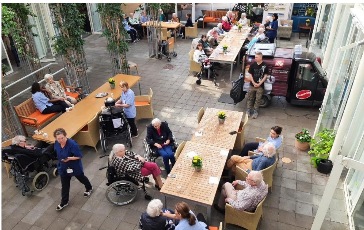
Kaffevogn og hjemmelavet kage den 15. april i Atriumgården