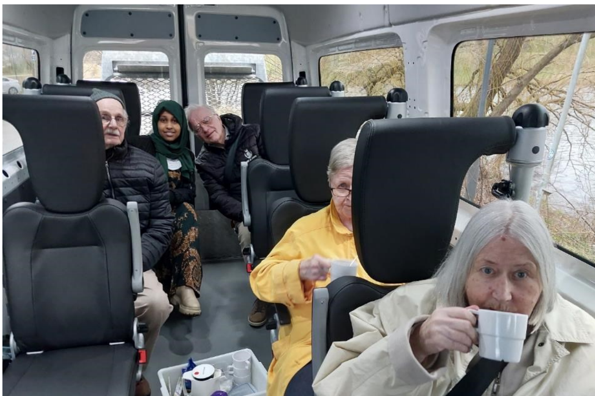
Udflugter i bussen i marts