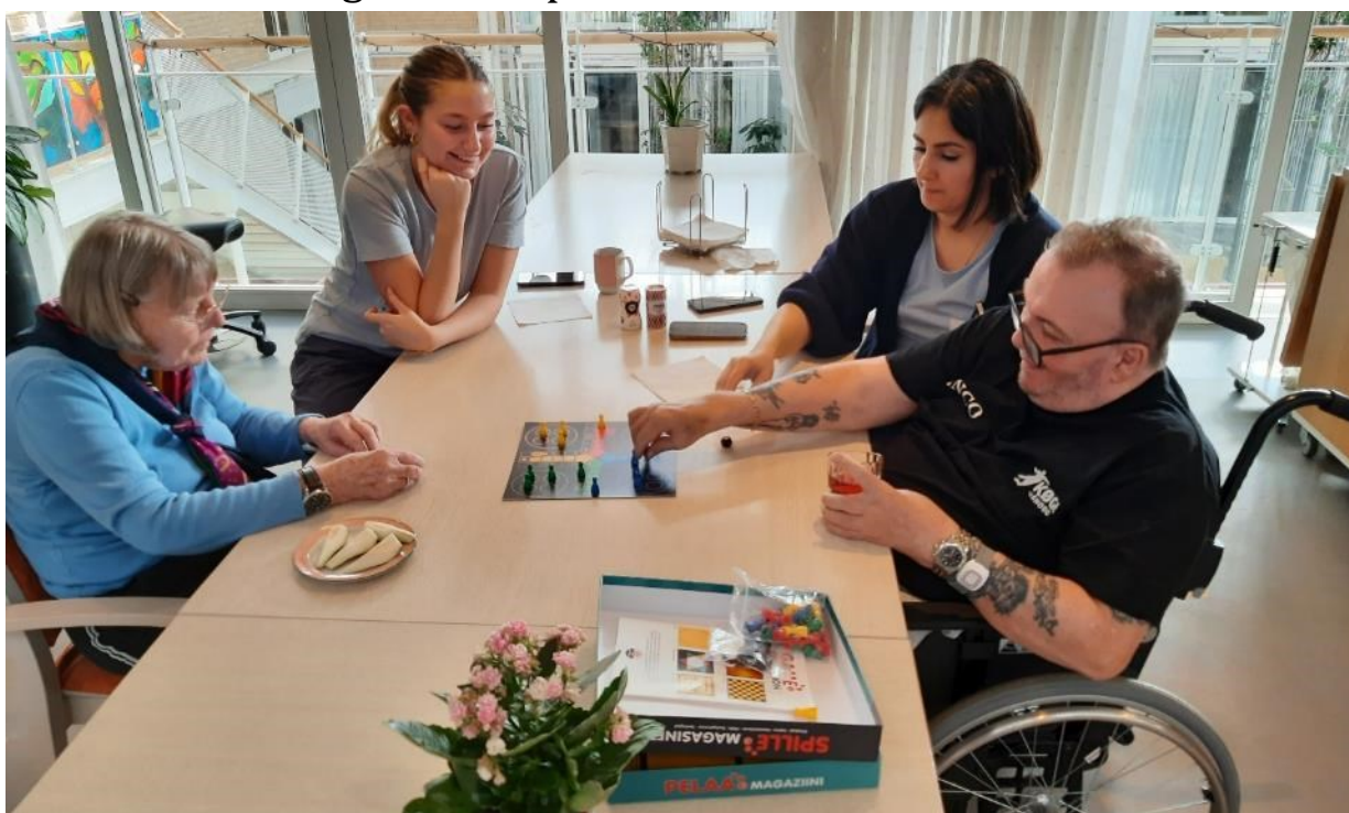
Der spilles spil på 1. sal.