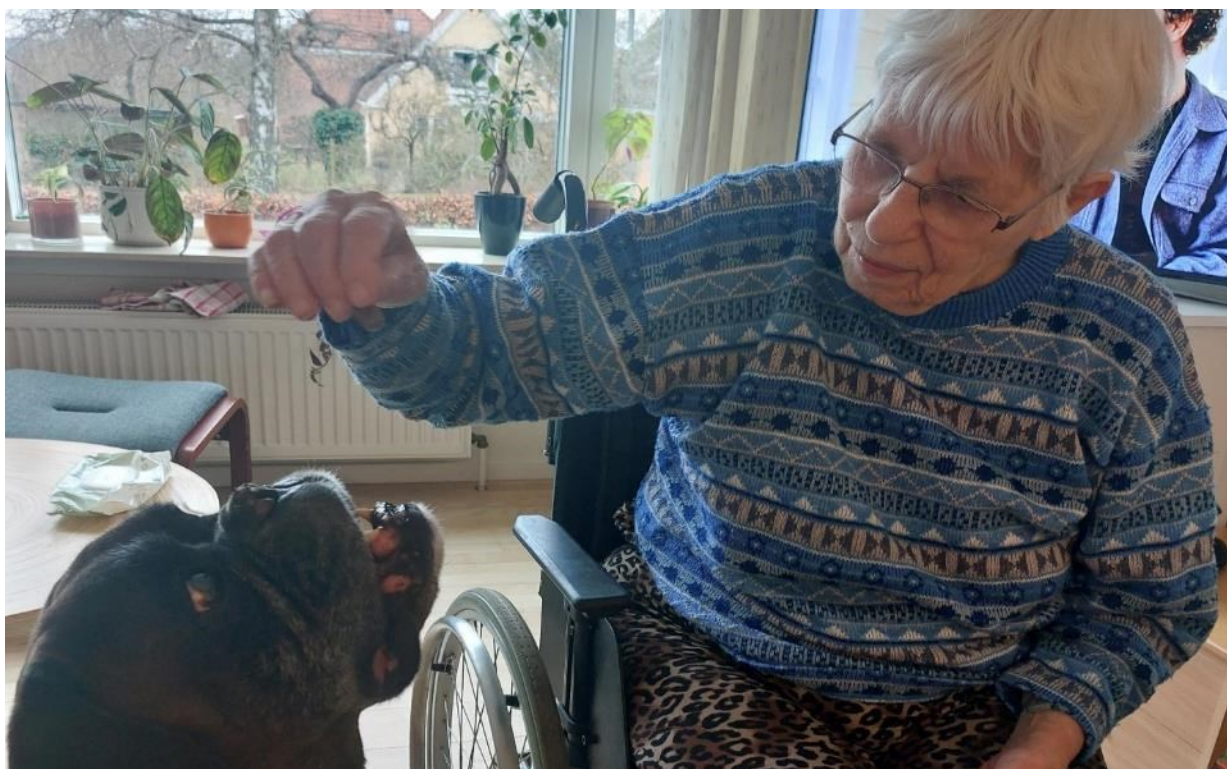
Besøgshunden Lopez er glad for godbidder.