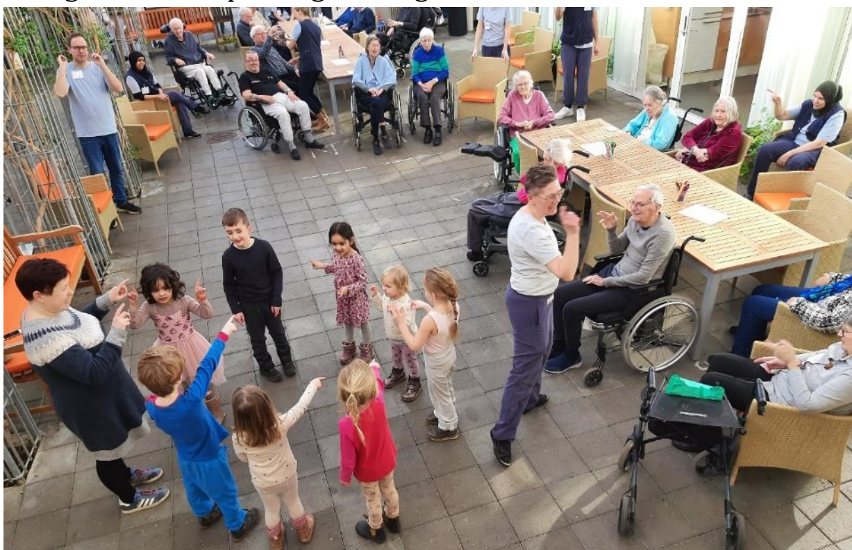
Børnehavebørnene bl.a. sang og lavede fagter, da de besøgte Salem sidst i februar.