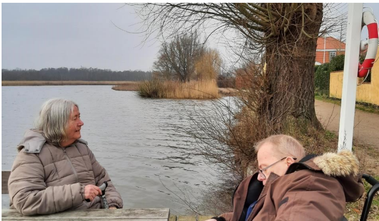
Spæde forårstegn kunne fornemmes på gåture til søen i marts.