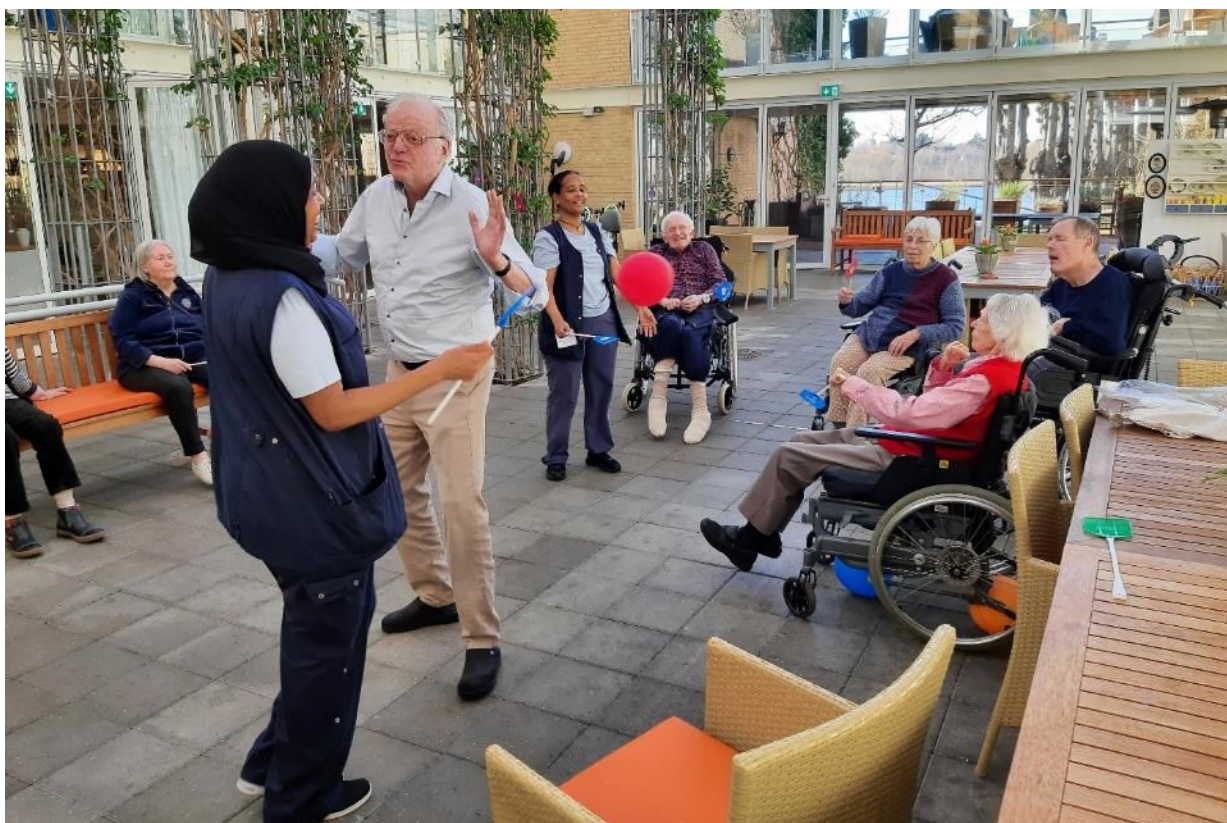
Gymnastik, dans og hundebesøg i marts