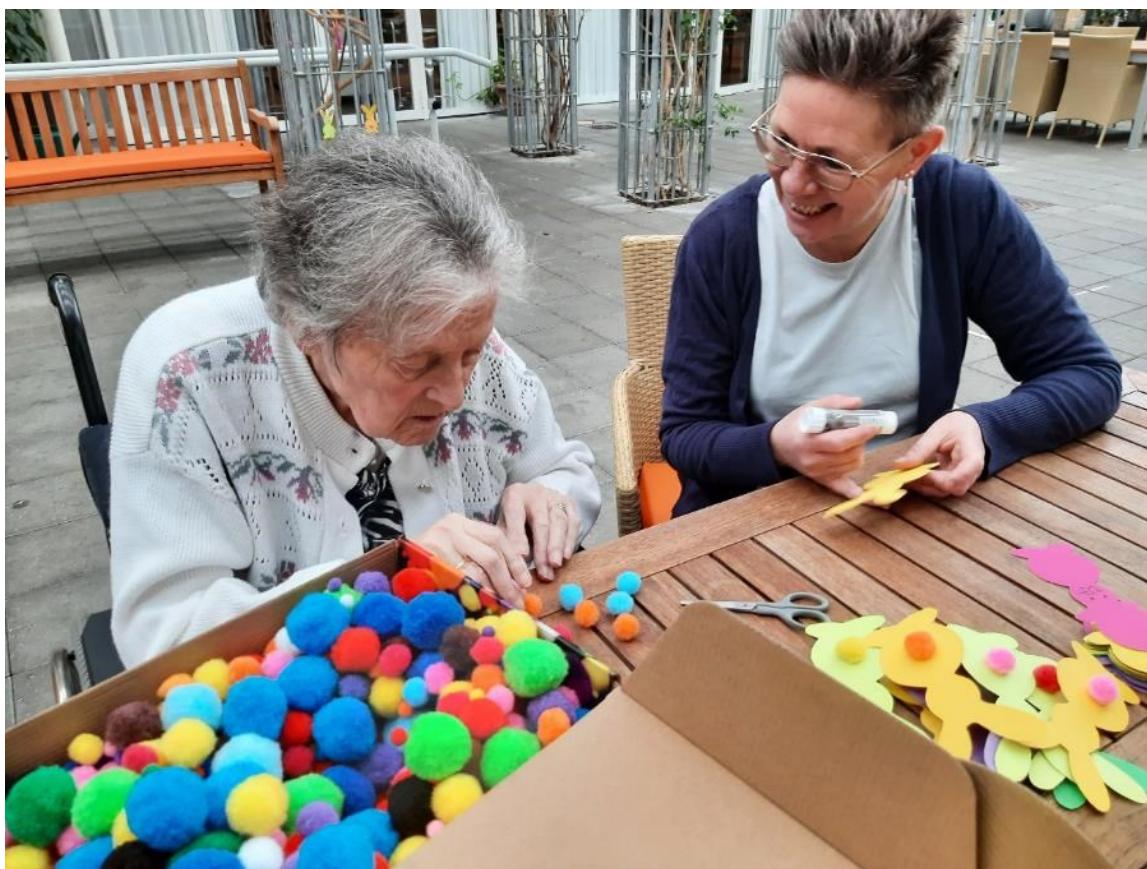
I marts har der også været påskeforberedelser.