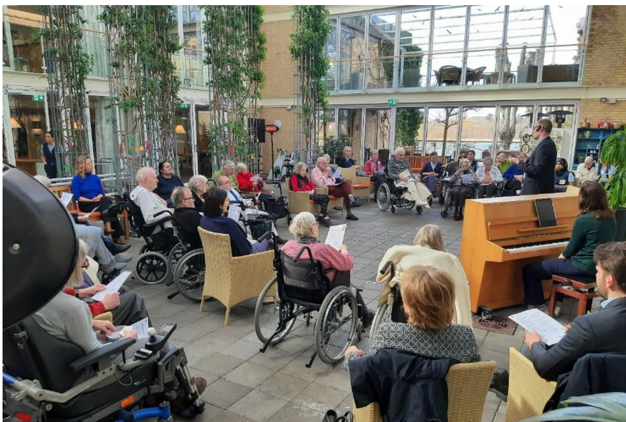
Påskemærking for alle beboere, pårørende og ansatte den 19. marts 2024.