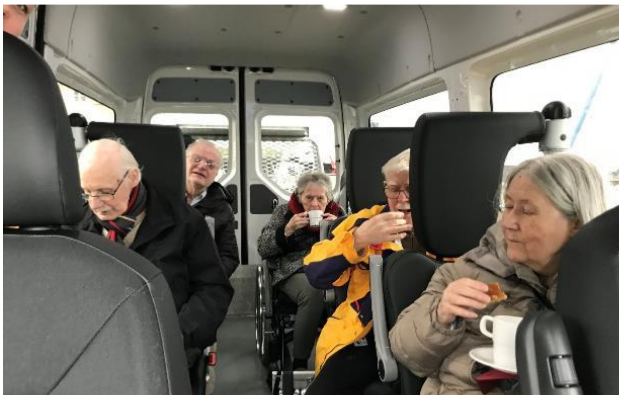
Udflugt for beboere i stueetagen til skov og vand. Kaffen og kagen blev nydt i bussen.