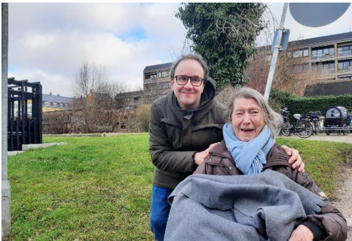
Gåtur i februar krævede et tæppe og godt overtøj.