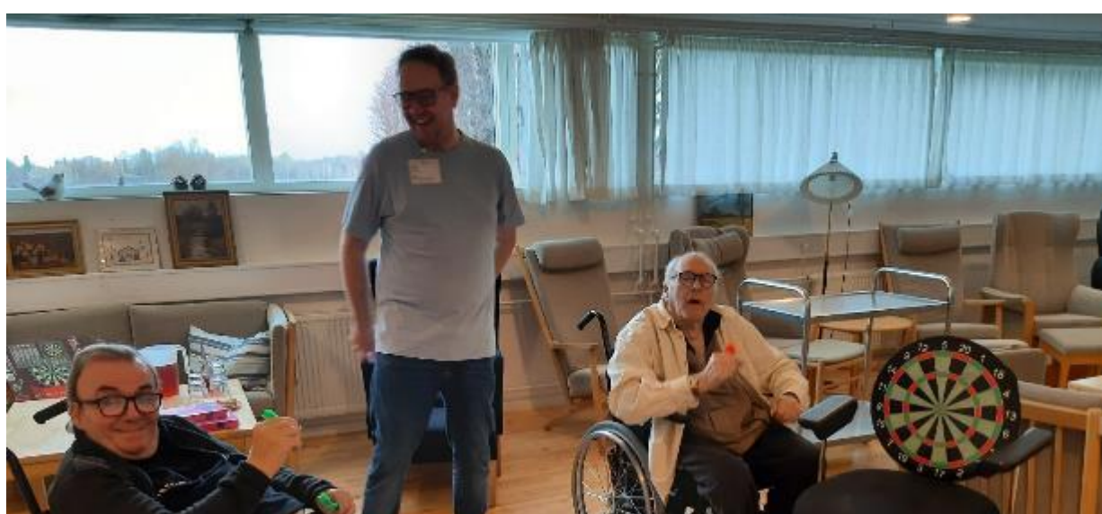
Dartspil en eftermiddag i kælderens under Salem. Til glæde for beboere og personale.