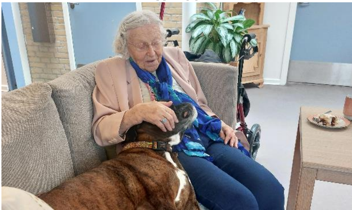
Besøgshunden Lopez skaber ofte mange nærværstunder, når han er på besøg.