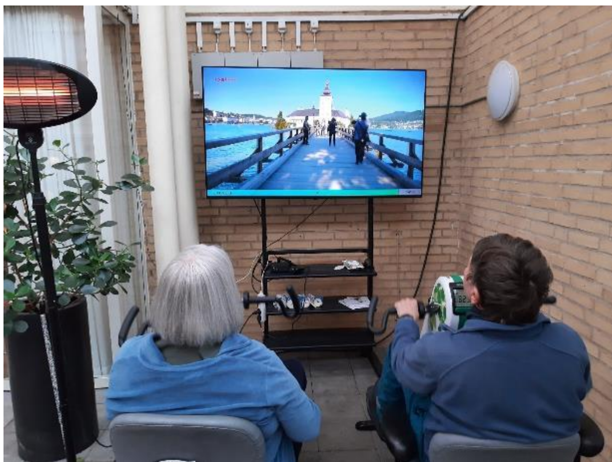
Indendørs cykling fredag den 9. februar, hvor "turen" bl.a. gik til smukke Gmunden i Østrig.