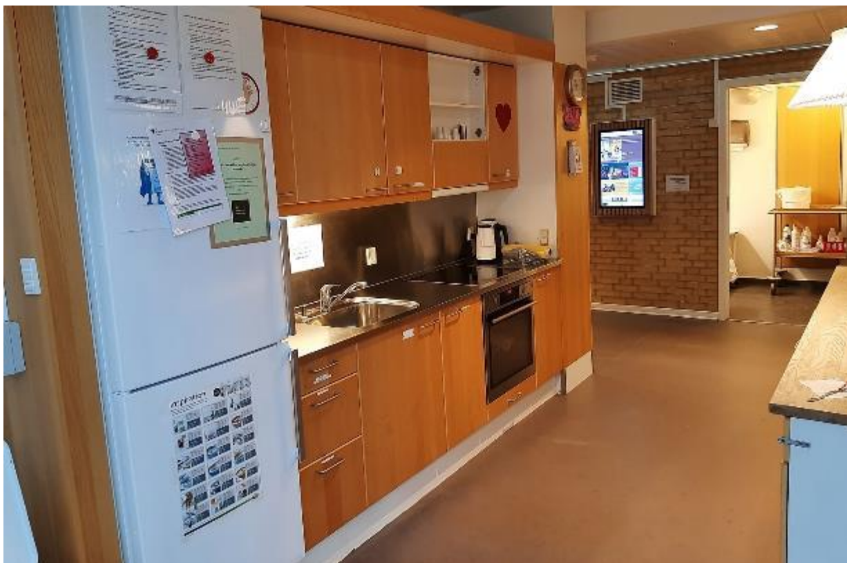
Køkkenområdet og opvaskerummet i Nearis Have.

Personalet oplever, at der er spørgsmål til brug af køkkenerne i afdelingerne. For at undgå misforståelser følger her en uddybning af reglerne på området.