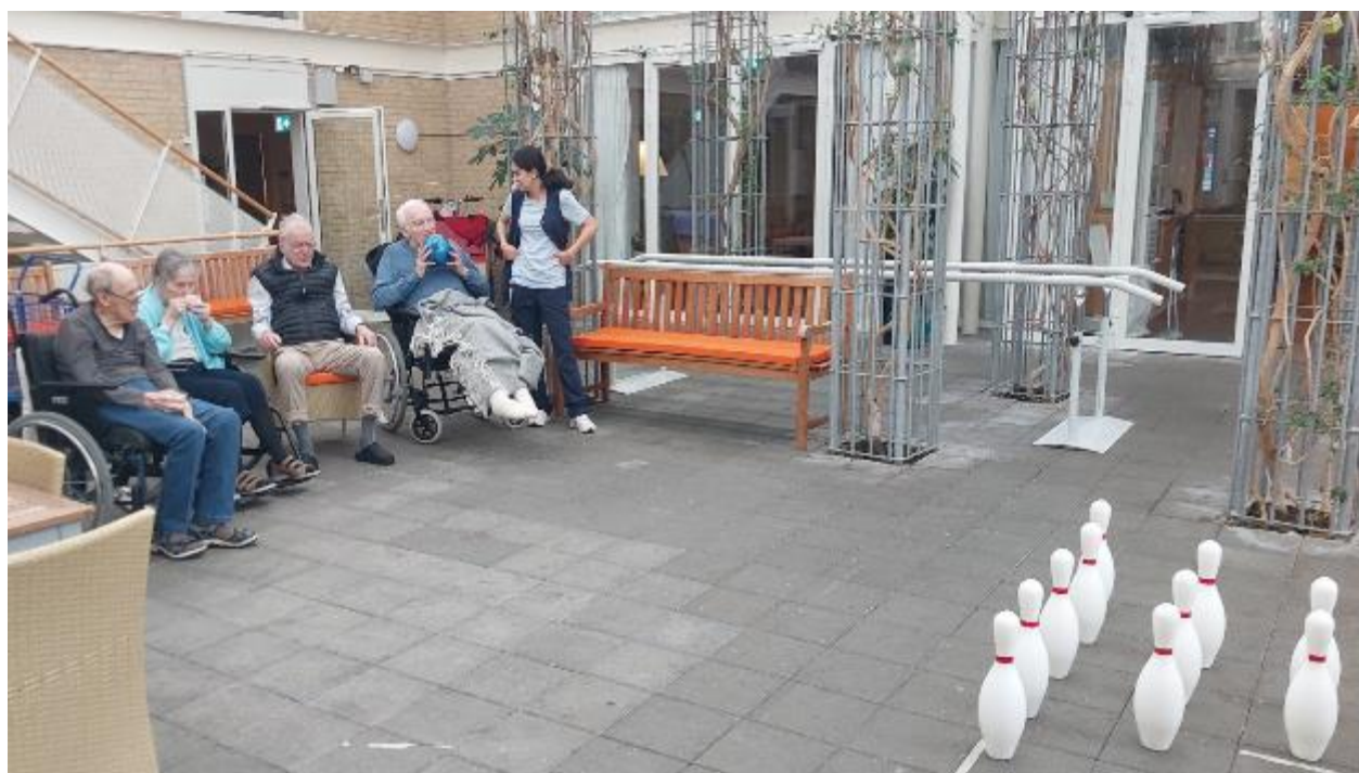
Bowling i stueetagen den 16. februar.