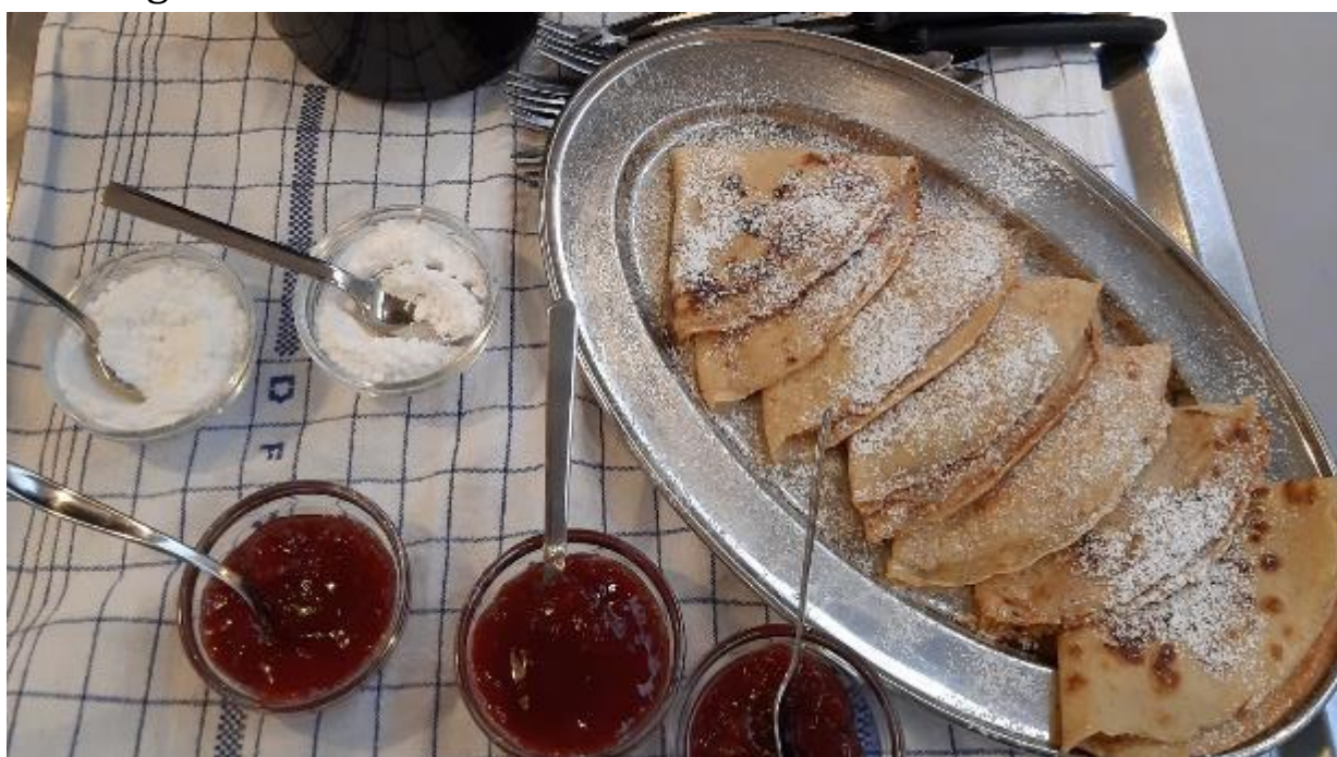
I anledning af hvide tirsdag (første tirsdag efter fastelavnssøndag) bagte personalet pandekager i afdelingerne til eftermiddagskaffen. Hvide tirsdag er også i moderne tid kendt som international pandekage dag.