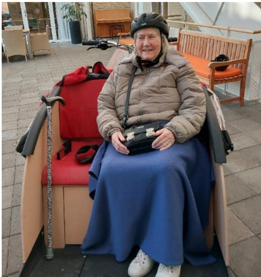
Cykeltur i rickshawen med en medarbejder en dejlig eftermiddag i februar.