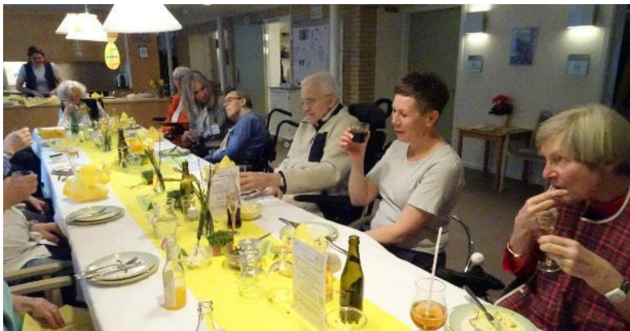
Foto fra Minnas Have til sidste års påskefrokost.